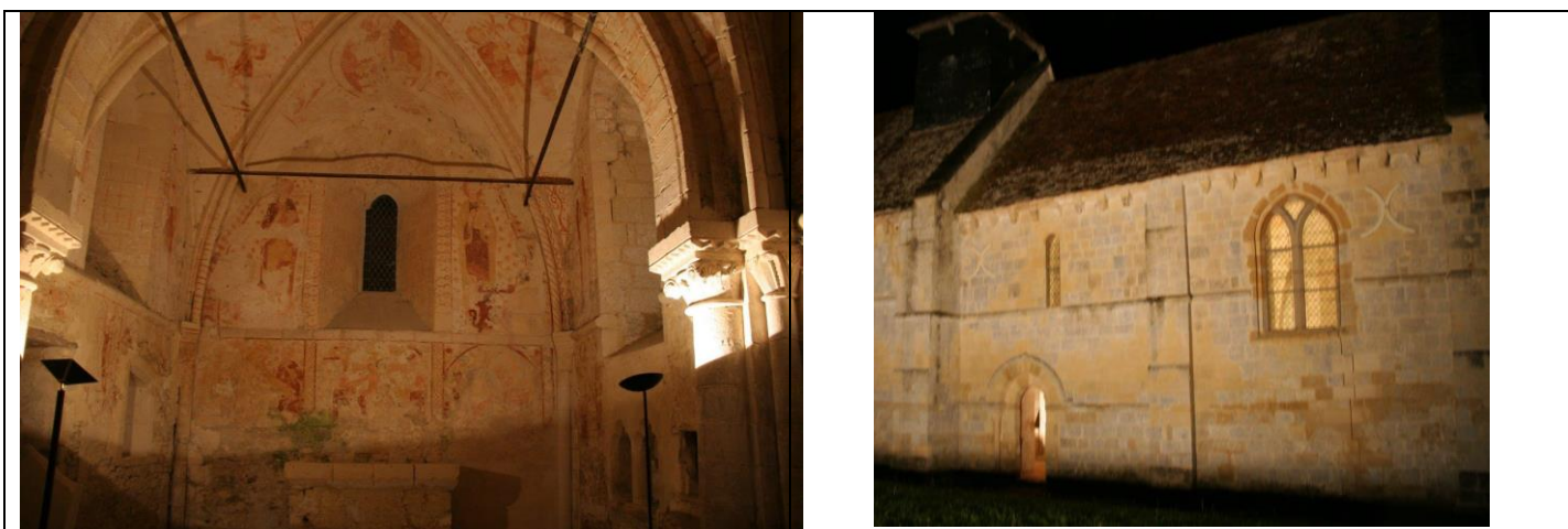
Réglages des éclairages de la chapelle en vue de la manifestation « Pierre en Lumières » du samedi 17 mai.

Concerts à 21 h 30 et 22 h 30, suivis d'une visite commentée. Nous espérons vous rencontrer.