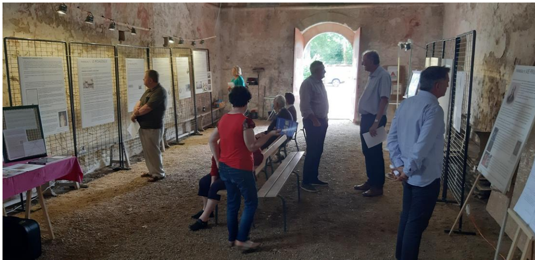
Jour d'ouverture de l'exposition